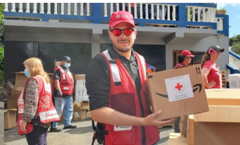
“Es una experiencia que no tiene costo; es una experiencia que no hay forma de hacerla tangible”